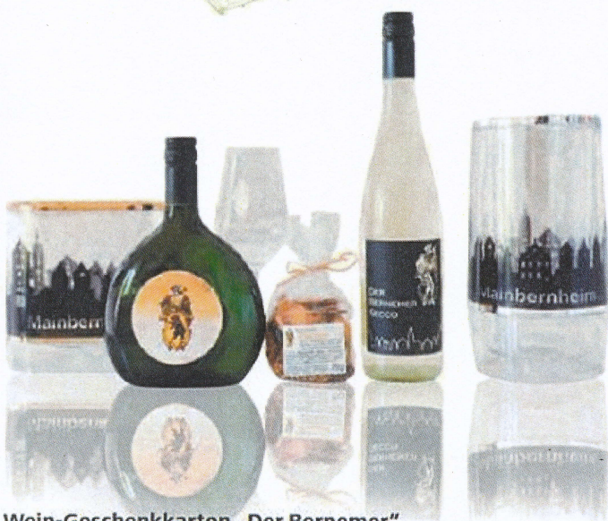
Wein-Geschenkkarton „Der Bernemer“